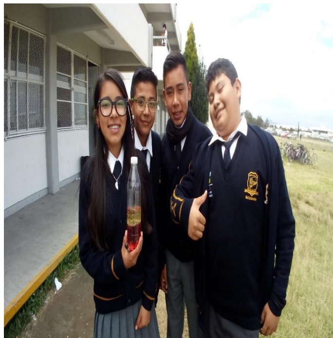
Presentación del proyecto acerca del tema: "estructura interna de la tierra"