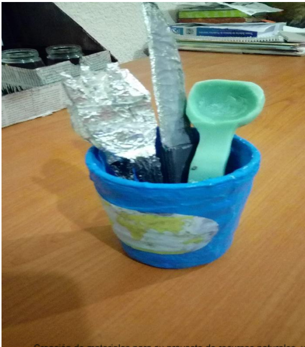
Creación de materiales para su proyecto de recursos naturales y materias primas