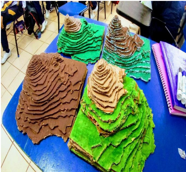
Maqueta del volcán Popocatépetl

Nota: se utilizó este volcán porque una zona cercana al municipio y que familiar para los alumnos de Huejotzingo.